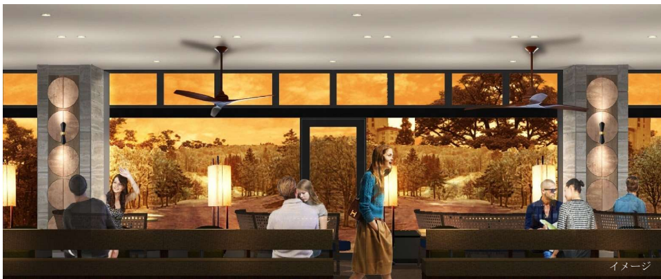
RRR Restaurant (フレンチステーキハウス) 窓側中央