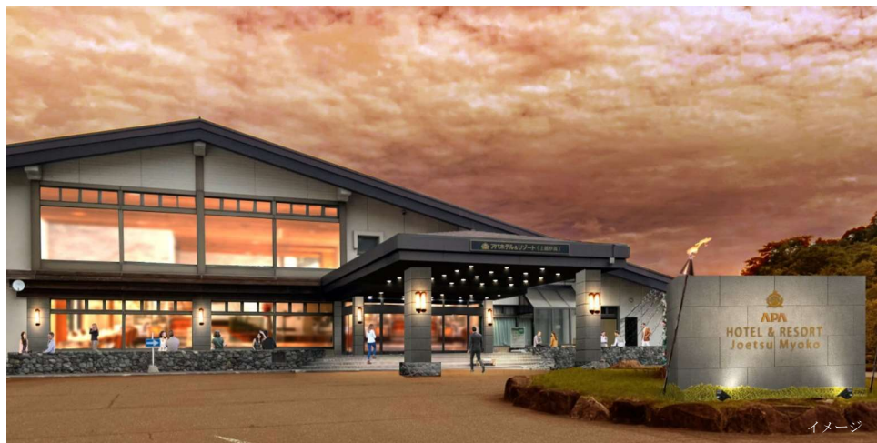
アパホテル&リゾート〈上越妙高〉ファサード

また、アパホテル&リゾート〈上越妙高〉本館のファサードについても同様にリニューアルし、お客様をお出迎える施設の顔であるエントランスがハイブランドな雰囲気に生まれ変わることで、最高のおもてなしを提供する。