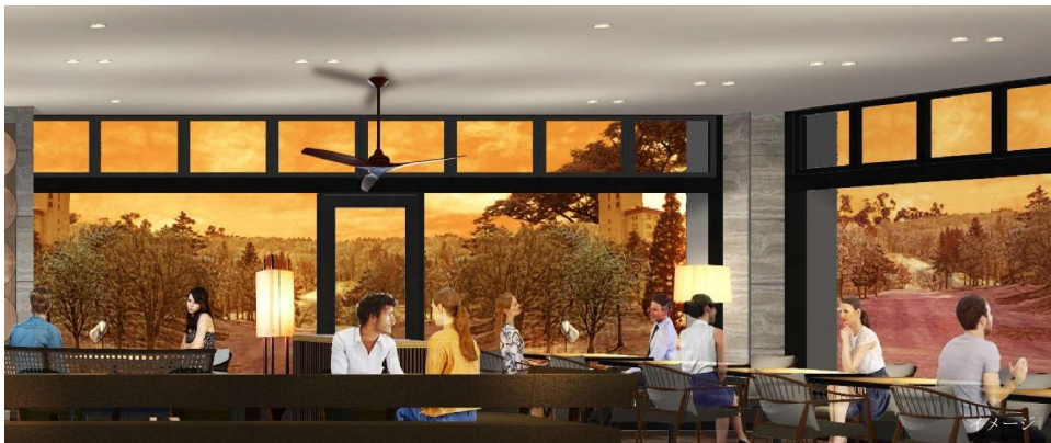
RRR Restaurant (フレンチステーキハウス) 窓側右手