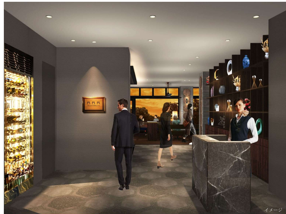
RRR Restaurant（フレンチステーキハウス）エントランス