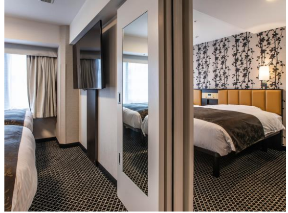
コネクティングルーム