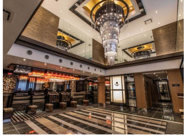
エントランスロビー