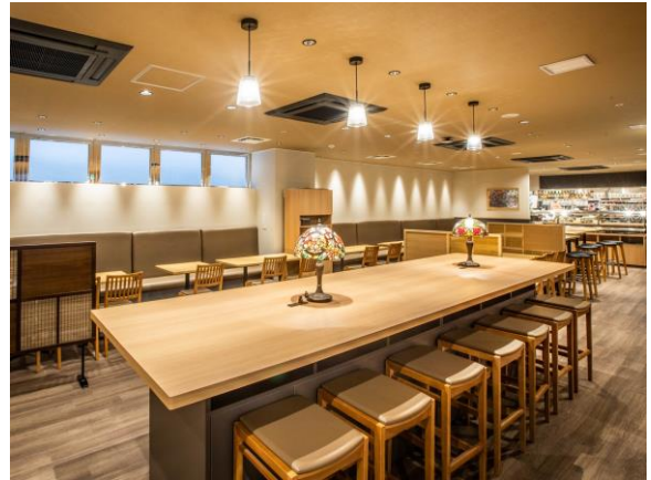
食堂・京の味「のんき亭」