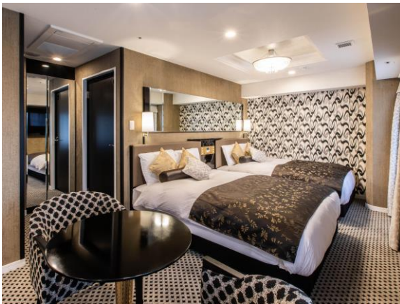
デラックスツインルーム