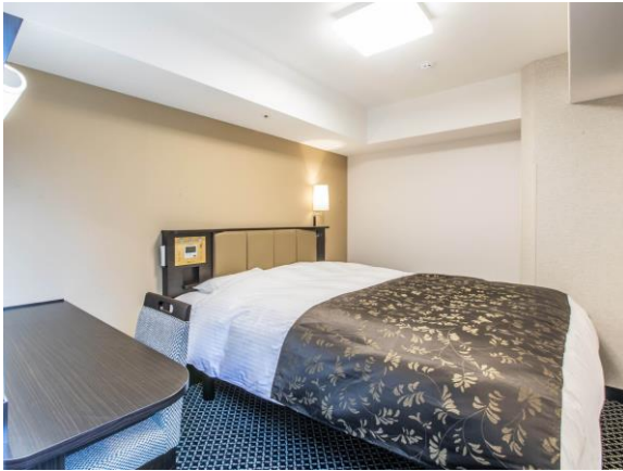
キングベッドルーム