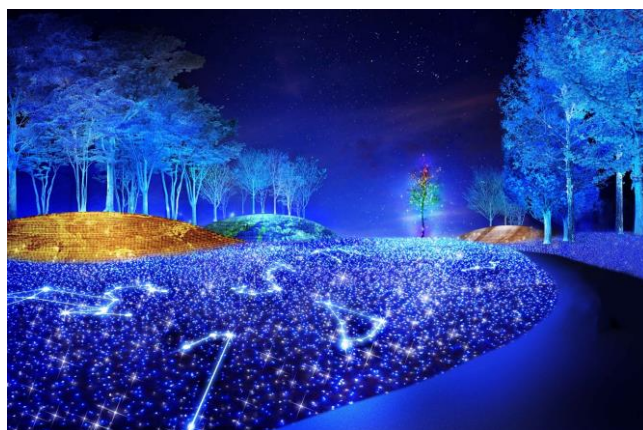
LED 電球による宇宙空間演出