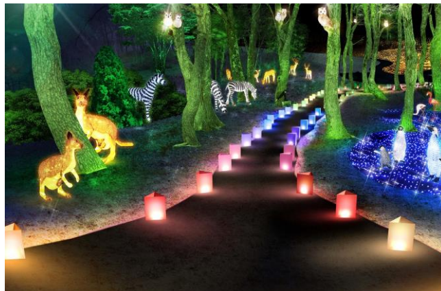
ナイトサファリ演出