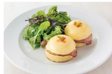
代表メニュー クラシックエッグベネディクト