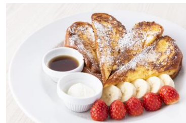
代表メニュー フラッフィーフレンチトースト