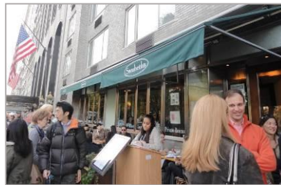
NY アッパーウエスト店