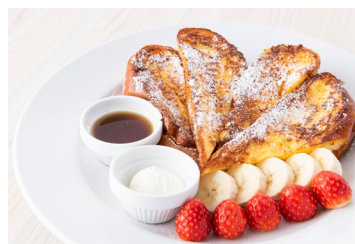
代表メニュー フラフイーフレンチトースト