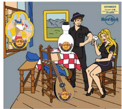
ウィングラス PIN SET 3,600円・税別