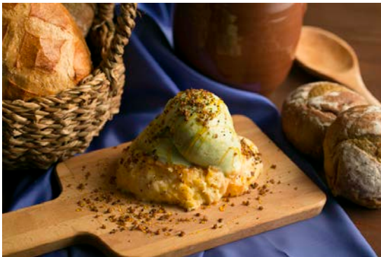
ブレッド&バターディング 980円・税別（コーヒーまたは紅茶付）

さらに、コラボレーション期間中、「フェルメール展」の半券を上野駅東京店でご提示いただくと、お会計から10%割引サービスが適用されます。（※割引サービスのご利用注意点はハードロックカフェ公式HPにてお知らせします。）