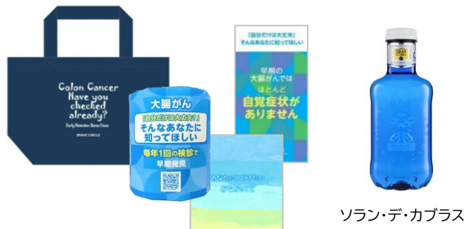
ソラン・デ・カブラス

当日はブルーのオリジナルミニトートバッグ等を全員にプレゼントして盛り上げます。またこの活動に賛同いただいたスリーポンド貿易株式会社より、綺麗なブルーのパッケージで人気の「ソラン・デ・カブラス」を一人様1本、参加者全員にプレゼント！