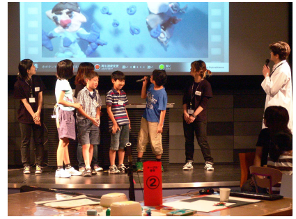
写真(3点)は『ソニー・サイエンスプログラム』アニメーション・ワークショップ(10年8月)開催時の様子