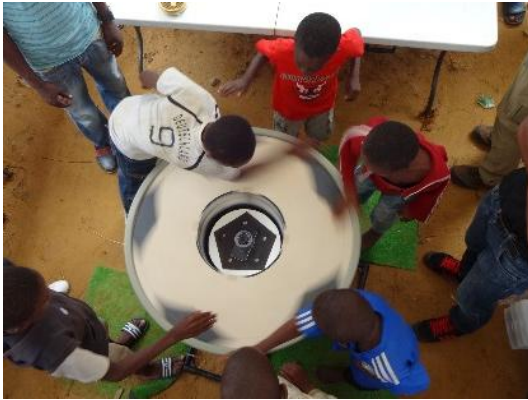
コートジボワールでのワークショップの様子