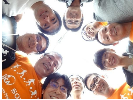
ニコニコ発電ワークショップ内で撮影した画像