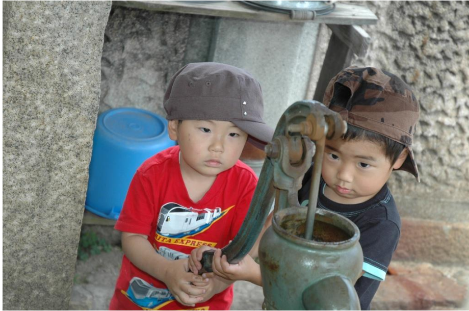
【科学する心賞】入選作品 『どうして水が出るのかな』 MAC(広島県)