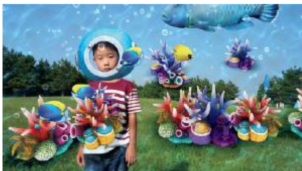
※「AR エフェクト」を使った画像の例