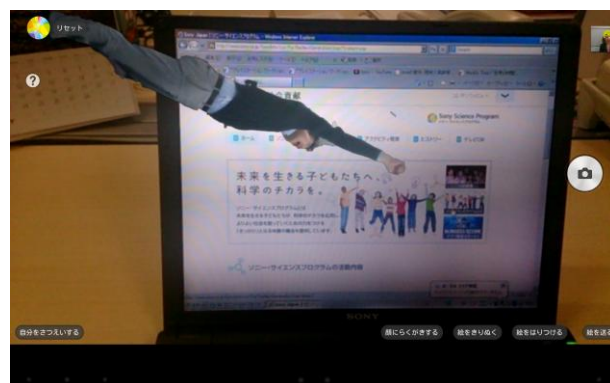
※「AR ワークショップ」用のアプリを使った画像の例