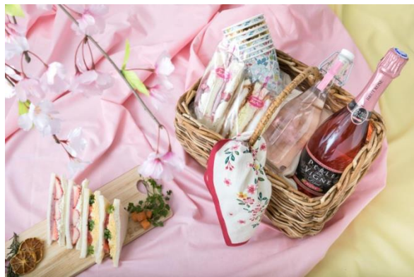
●お花見アイテムはバスケットに入れて持ち運び！