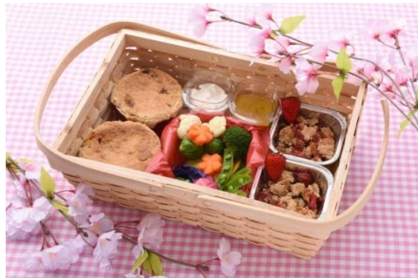
●子供も喜ぶ 豆のポットパイ弁当