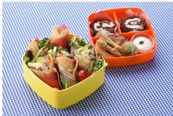
●女性が喜ぶ 野菜たっぷり弁当