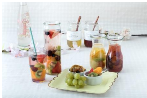
●カスタマイズドリンクでワンランクアップのお花見！