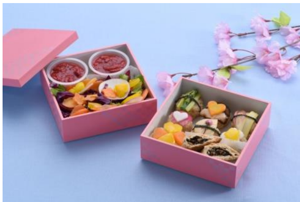
●彩り鮮やか 手まり寿司弁当