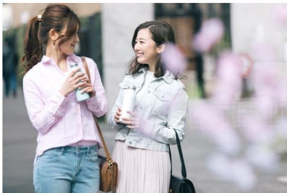
●桜カラーのリンクコードでお花見散歩！

http://event.atre.co.jp/sakura2017/party/