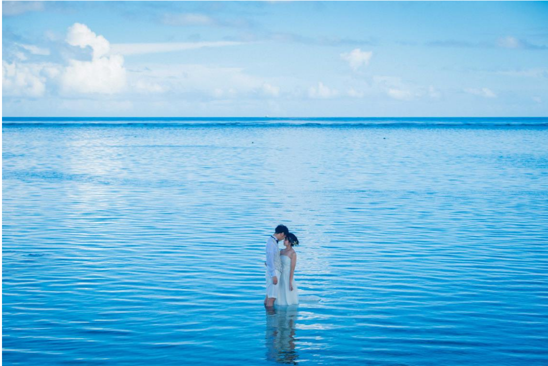
上図は無人島クエフ島結婚式プランの撮影カット