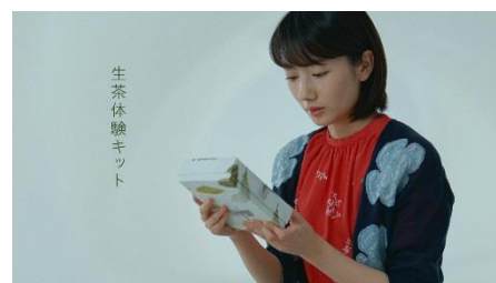
「体験キット・・・」