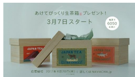
Na: 体験キットも入った、あけてびっくり生茶箱、3月7日スタート