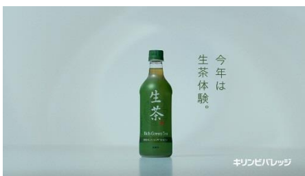
Na：今年は今、生茶体験。