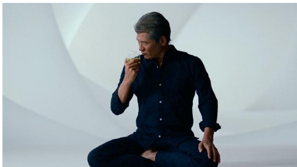
【麒麟生茶 吉川 香り篇】