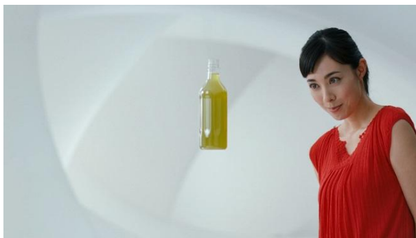
【麒麟生茶 吹石 ボトル篇】