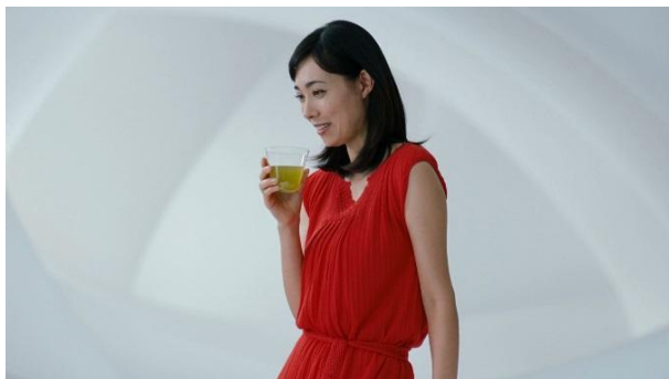
【麒麟生茶 吹石 味篇】