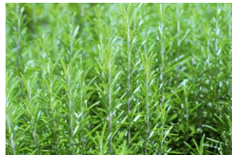
ローズマリー葉エキス