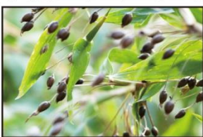
※ハトムギ種子エキス・加水分解ハトムギ種子