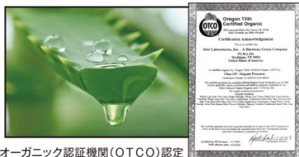
オーガニック認証機関(OTCO)認定