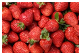
いちご果汁（フラガリアチロエンシス果汁）