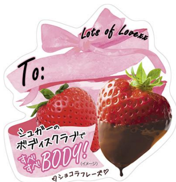
相手の名前を書きこめるイチゴPOP付き

2月14日のバレンタインにギフトとして送れるように、相手の名前を書きこめるイチゴPOP付きの仕様になっています。女性同士でちょっとしたプレゼントを交換する「友チョコ」にもおすすめです。