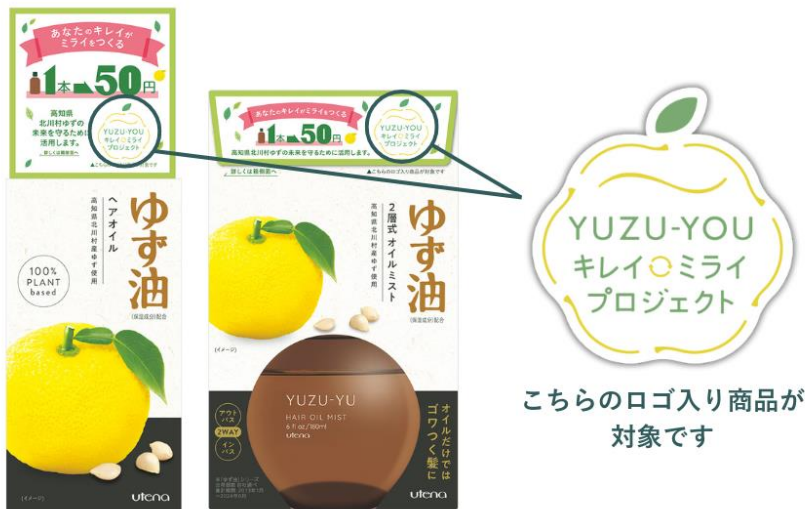
こちらのロゴ入り商品が対象です