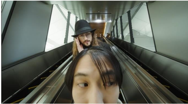
最近薄毛が気になってきた僕の前に