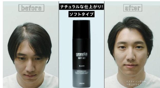
※スタイリング効果による ※仕上がりイメージ