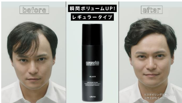
※スタイリング効果による ※仕上がりイメージ