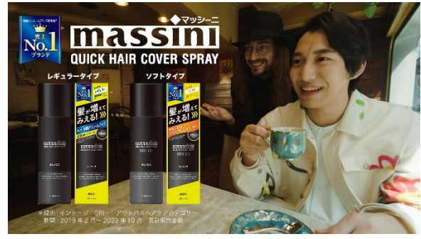
自分らしい髪で、表情も明るくなった僕