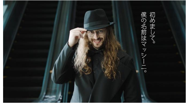
謎の男“Mr. マッシーニ”が現れる