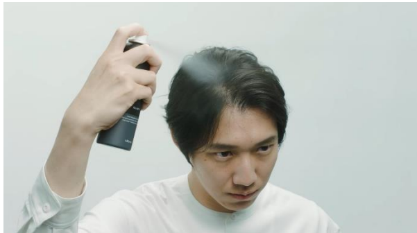
マッシーニを吹きかけるとナチュラルにボリュームアップ