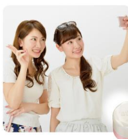
まとめ髪スティック レギュラー ホワイトフローラルブーケの香り