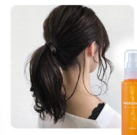
まとめ髪アレンジウォーター