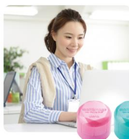
まとめ髪スティック レギュラー・スーパーホールド