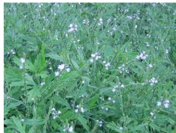
ヴァーベナエキス※2 (すべて保湿成分)