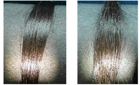
毛束に試料を塗布し、一定の角度から光を照射。 左：ゆず油を塗布した毛髪、右：未塗布の毛髪

アウトバストリートメントでダメージヘアのめくれたキューティクルをしっかりコーティングしましょう。髪表面がととのうことで光がきれいに反射し、艶が生まれます。紫外線や乾燥から髪を守ってくれる効果もあります。