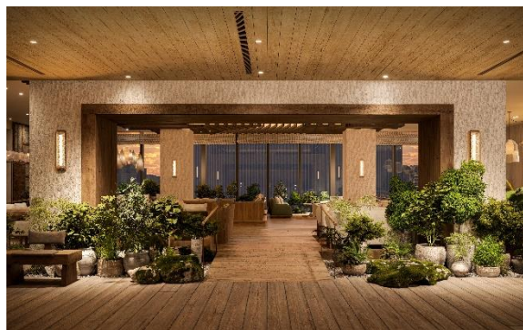
ロビーラウンジ イメージ

森トラストは、変化する社会ニーズに応え、新たな都市の価値を創造することを目指し、様々なプロジェクトを手掛けてきました。赤坂エリアにおける大規模複合開発プロジェクト「東京ワールドゲート赤坂」では、約5,600 m 2 におよぶ緑地整備によって緑豊かなオープンスペースの創出や環境負荷低減の取り組みを進めております。この度、本プロジェクトを体現するラグジュアリーホテル「1 Hotel Tokyo」の誘致が実現しました。