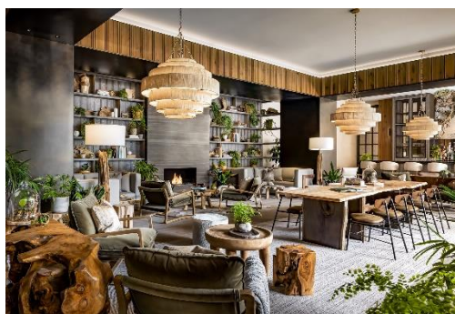
1 Hotel Toronto