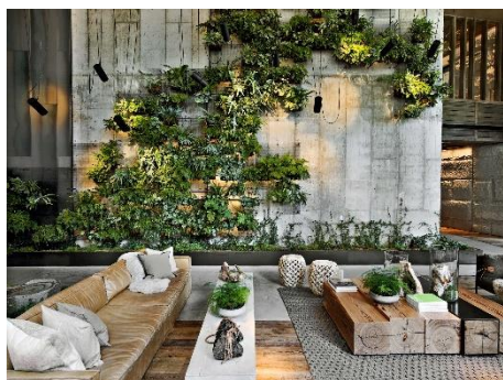
1 Hotel Brooklyn Bridge

「1 Hotels」は、自然を取り入れた持続可能なデザインと最高級のサービスを提供しているラグジュアリー・ライフスタイルホテルブランドです。2015年にマイアミとマンハッタンで初めてオープンし、その後ブルックリン、ウェストハリウッド、三垂、トロント、サンフランシスコ、ナッシュビル、ハナレイベイ、ロンドンへと拡大しました。「世界を旅する人々は、その場所を大切にすべきだ」という理念に基づき、カボサンルーカス、パリ、クレタ島、オースティン、コペンハーゲン、リヤド、メルボルン、シアトル、サン・ミゲル・デ・アジェンデで新たなプロジェクトが進行中です。