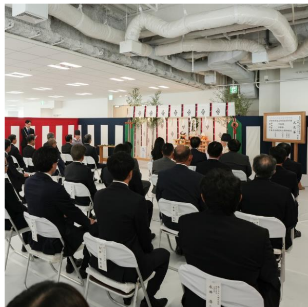
「東京ワールドゲート赤坂」竣工式の様子

「東京ワールドゲート赤坂」は、東京圏国家戦略特別区域(通称「国家戦略特区」)における国家戦略都市計画建築物等整備事業として認定を受けた、虎ノ門・赤坂エリアの国際競争力強化を推進する大型複合開発プロジェクトです。街区コンセプトに「Next Destination」を掲げ、従業員エンゲージメントの向上に資するオフィスフロアの提供や、国際水準のホテルおよびサービスアパートメントの展開を予定しています。加えて、赤坂の地に根ざした歴史文化を発信する施設の開設、大規模緑地の整備などを通じて、ビジネスと観光の両面から、世界と日本をつなげるゲートの機能を担うような拠点づくりを進めております。