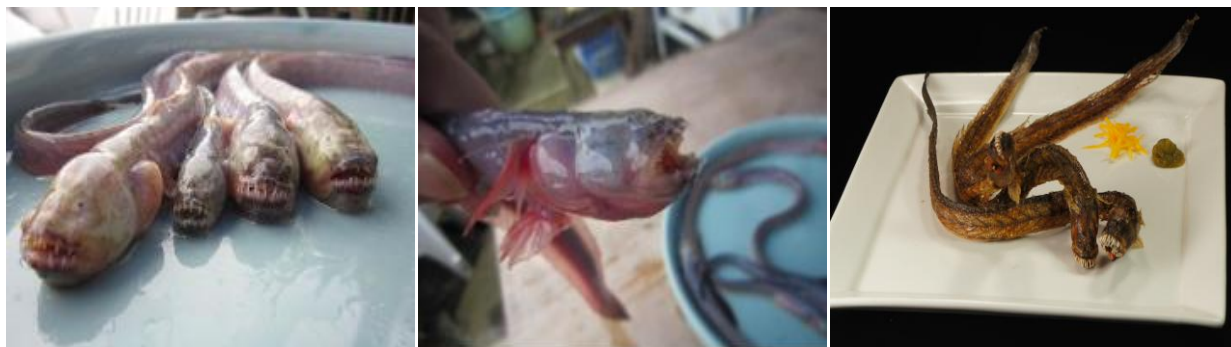
※有明海のワラスポを生きているまま仕入れその場で素揚げに

ウツボ(海のギャング) アブラボウズ(幻の超巨大深海魚) アオサメ(世界三大人喰いサメ)、 マンボウ(水族館の人気者) ワラスポ(海のエイリアン) など7~8種 約10品のビュッフェ