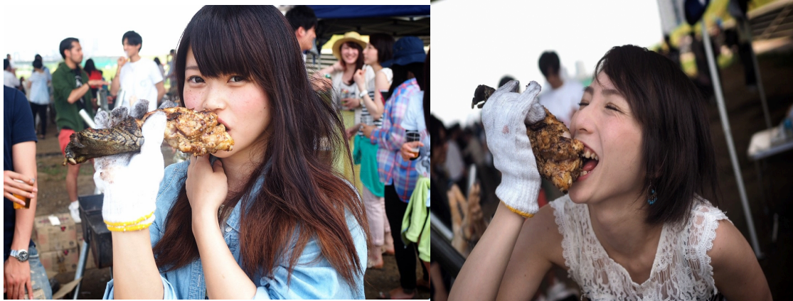
※見たこともない食材の数々に参加者の誰もが驚愕する新感覚なグルメイベント

「クロコダイル」「カンガルー」「ラクダ」「ダチョウ」「ウサギ」「ヤギ」「ウマ」「クマ」「シカ」「トド」 など過去には 15 種類ほどの肉を焼いてきた同イベントが、今回は特別にハロウィン限定の世にも奇妙な珍肉ハロウィン料理として参加者に振舞うこととなっている。さあーて、今回はどんなお肉が現れるかな