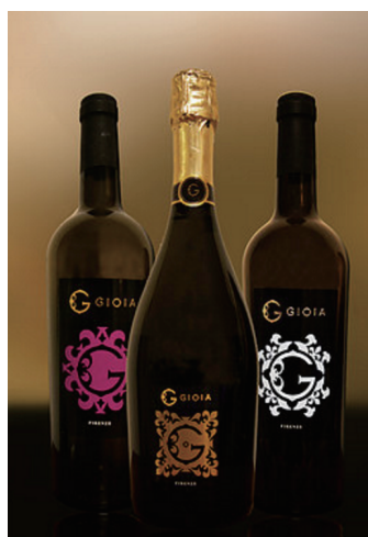
左から 「GIOIA Rosso(赤)」 「GIOIA Procecco (スパークリング)」 「GIOIA Bianco(白)」