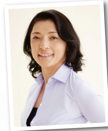
ワークライフバランスの 実践者 勝間 和代 氏 経済評論家