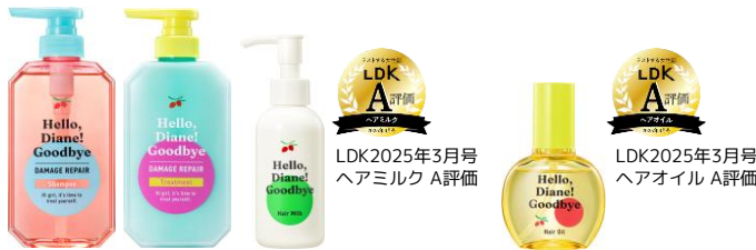
ハロー、ダイアン！グッバイ