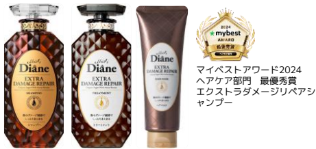
エクストラダメージリペア

マイベストアワード2024 ヘアケア部門 最優秀賞 エクストラダメージリペアシ ャンプー