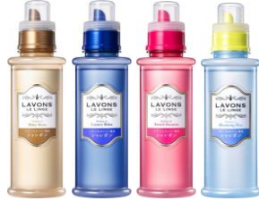
オシャレ着用洗剤