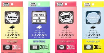
エアコン送風口用 クリップタイプ