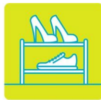
玄関・シューズボックス