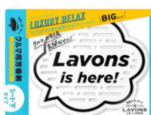
ラグジュアリーリラックス