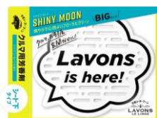
シャイニームーン