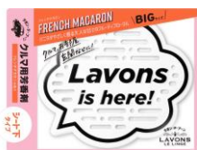
フレンチマカロン