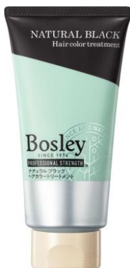
ナチュラルブラック