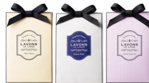
加湿器用 フレグランスウォーター