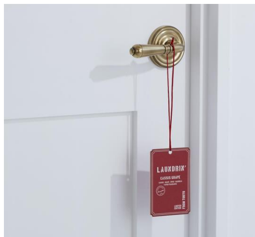
ペーパーフレグランス