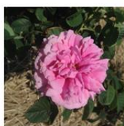
ダマスクローズエキス