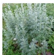
ワームウッドエキス※3