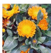
カレンデュラエキス※2