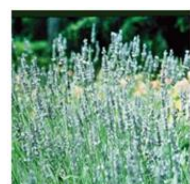
ラベンダーエキス