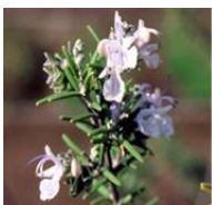
ローズマリーエキス