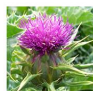
ブレッドシスルエキス※4

(エキスは全てオーガニック基準です) *1 タチジャコウソウ花/葉エキス *2 トウキンセンカ花エキス *3 ニガヨモギエキス *4 サントリソウエキス (全て保湿成分)