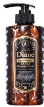
オイルシャンプー エクストラダメージリペア 500ml 838 円 (税抜)