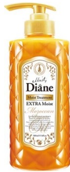
オイルトリートメント エクストラモイスト 500ml 838 円 (税抜)