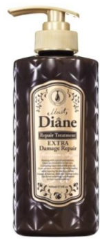
オイルトリートメント エクストラダメージリペア 500ml 838 円 (税抜)