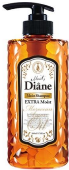
オイルシャンプー エクストラモイスト 500ml 838 円 (税抜)