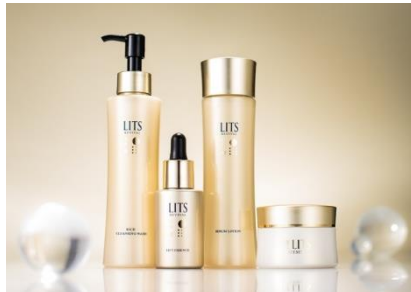
LITS REVIVAL(リッツリバイバルシリーズ)