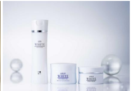
LITS WHITE(リッツホワイトシリーズ)