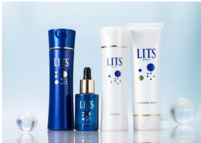
LITS MOIST(リッツモイストシリーズ)