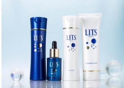
LITS MOIST (リッツモイストシリーズ)

“LITS”シリーズは、年齢によって変化する肌にあわせ、過酷な環境で育つ植物の幹細胞を由来とした成分を、アイテムごとに厳選採用。肌を丁寧に整えながらたっぷり潤す、20年後の素肌を見据えたスキンケアシリーズです。モイストシリーズ、リバイバルシリーズ、またホワイトシリーズも新たに加わり、20代～50代までの幅広い年齢層の方にご使用いただき、ご好評をいただいております。