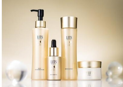
LITS REVIVAL (リッツリバイバルシリーズ)