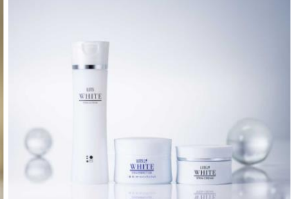
LITS WHITE (リッツホワイトシリーズ)