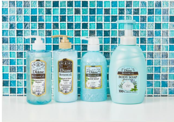
泡ボディーソープ リフレッシュ&モイスト 800mL 998円(税別)

洗うほどに保湿力を高め、お肌の潤いを守ってくれるオリーブ洗浄成分※1に、肌をすこやかに保つローズマリーエキス、キメを整えるセージエキスを配合。洗っている間も、たっぷりと潤いを与えてくれるため、肌に必要な油分を残しつつ潤いを守ってくれます。敏感肌※2の方でも安心してご使用いただけます。