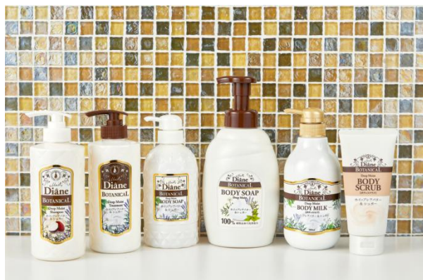
泡ボディーソープ ディープ&モイスト 800mL/998円(税別)

肌を乾燥から守り、潤いをキープするシアバター※3、なめらかでやわらかいハリのある肌にしてくれるオーガニックシュガー※4や、厳選したオーガニックオイルを配合。ふっくら、モコモコの濃密泡が、毎日のバスタイムを楽しく、癒しの時間にしてくれます。