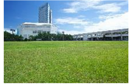
シーガイアスクエア1