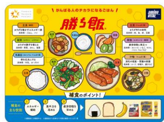
シーガイアオリジナル 「勝ち飯®」ランチョンマット

さらに、目的に応じて必要な栄養素を必要なタイミングでとれるよう、補食をオプションにてご準備いたします。(例:フルーツ+おにぎり等)