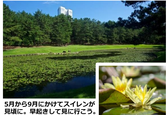
5月から9月にかけてスイレンが見頃に。早起きして見に行こう。

みそぎ池からほど近くの「江田神社」は、イザナギノミコト、イザナミノミコトを祀り、安産祈願や恋愛成就などのご利益で、みそぎ池と合わせ人気のパワースポットとなっています。