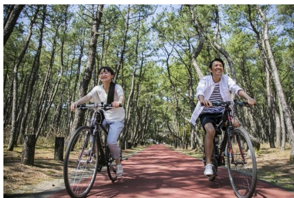
広大な黒松林で快適なサイクリングが楽しめる。

広大な黒松林には、フラットで走りやすいサイクリングロードが整備されており、爽やかな風を感じながらサイクリングを満喫することができます。今回はリゾートエリアのほぼ中心に位置する「シェラトン・グランデ・オーシャンリゾート」を起点に、目的地に最適な立ち寄り先をご紹介します。