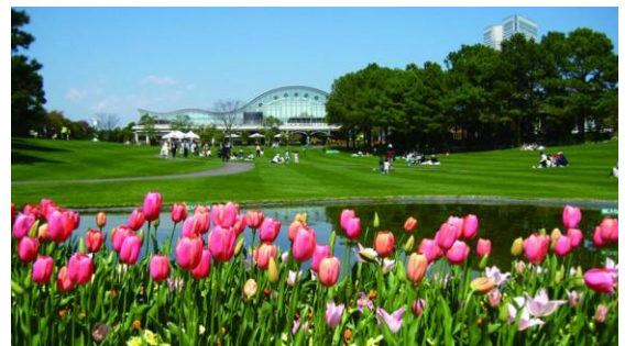
芝生の上で走ったり、お子様も思いっきり楽しめます。