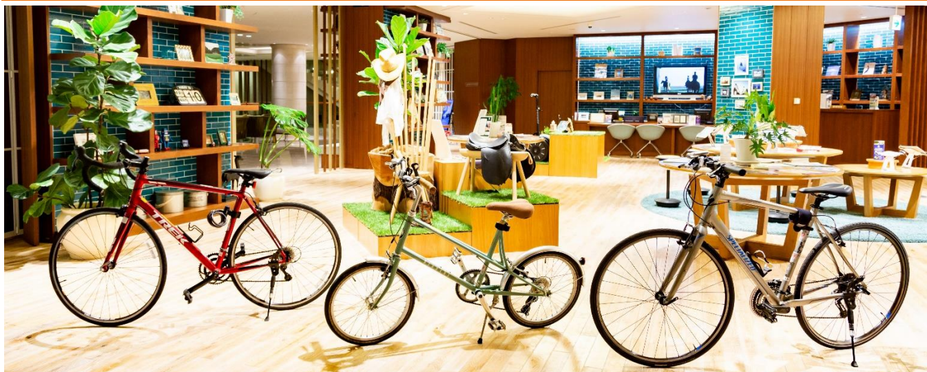
左からTREKのロードバイク、Bianchiのミニベロ、Specializedのクロスバイクなど、50台を超える多彩なレンタサイクルが揃う。