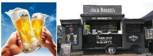
ジャックカーが登場！