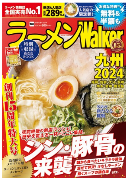
『ラーメン Walker 九州 2024』

株式会社角川アスキー総合研究所（本社：東京都文京区、代表取締役社長：加瀬典子）は、『ラーメン Walker2024』の第 4 弾として、九州版（2023 年 11 月 17 日発売）、千葉版（2023 年 11 月 27 日発売）、茨城版（2023 年 11 月 29 日発売）を順次刊行します。