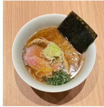
2022年出店時の提供ラーメン「鴨と蛤の醤油そば」