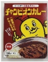
「チャンピオンカレー（中辛）」 株式会社チャンピオンカレー+TK