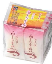
「越中富山湾 白えびかき餅 14袋」 株式会社御菓蔵