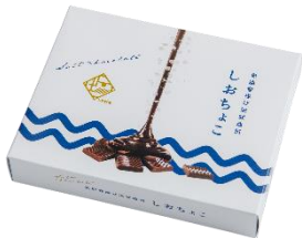
「しおちょこ」 株式会社 Ante