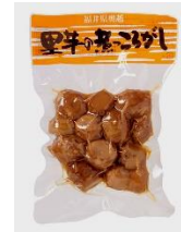
「福井県奥越 里芋の煮ころがし」 有限会社米又