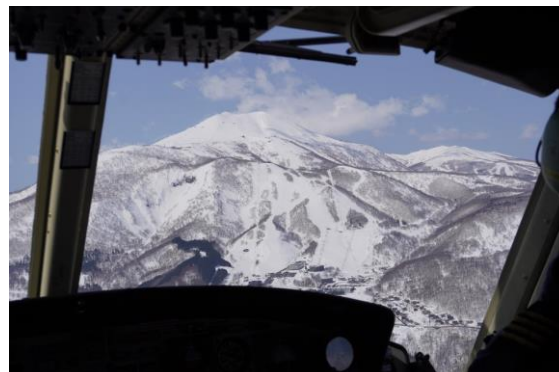
冬の観光地へのヘリツアーのイメージ