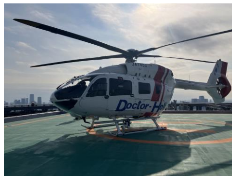
2023年度実証（新宿ミライナタワー）の様子

2023年12月にはJR新宿ミライナタワーおよび長野駅近隣ヘリポートを活用し、ヘリコプターを使用した実証実験を行いました。この際に発見した課題を、本実証にて検証し将来的な駅隣接ヘリポートを活用したサービスの検討やヘリポート開発の可能性を検証します。