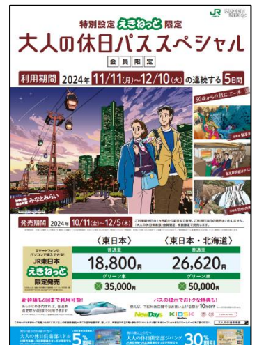
【大人の休日パス SP ポスター】