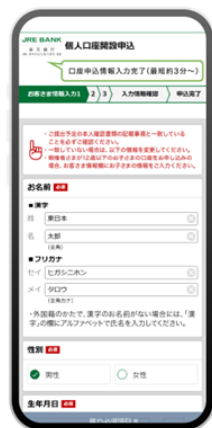
2 口座開設情報入力