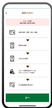
3 JRE BANKアプリで書類を提出