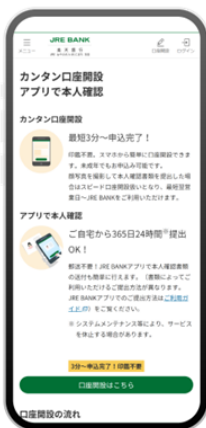
1 JRE BANKホームページ等から口座開設申込へ