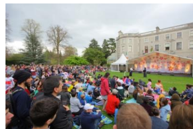
過去のイベント様子